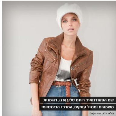
משפטים ומינהל עסקים