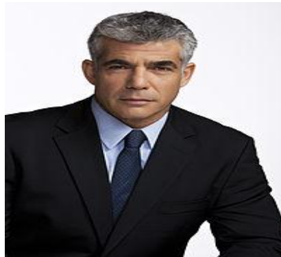
אין תואר אקדמי