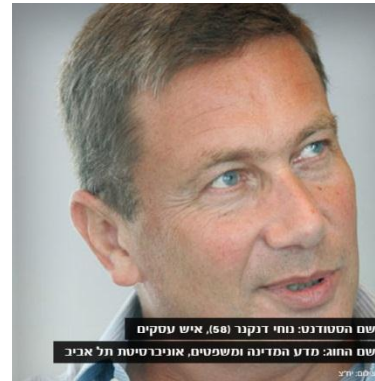
מדע המדינה ומשפטים